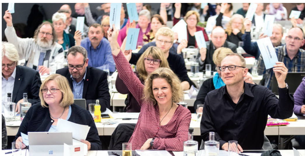
Die Bundestarifkommission beschließt am 14. Dezember 2016 in Berlin die Forderungen zur Tarif- und Besoldungsrunde 2017.

Die ver.di-Tarifkommission für das Land Hessen für den öffentlichen Dienst hat eine Forderung im Volumen von 6 Prozent für Tabellenerhöhungen und strukturelle Verbesserungen der Eingruppierung unter Berücksichtigung einer sozialen Komponente für die Tarif- und Besoldungsrunde 2017 mit dem Land Hessen beschlossen.